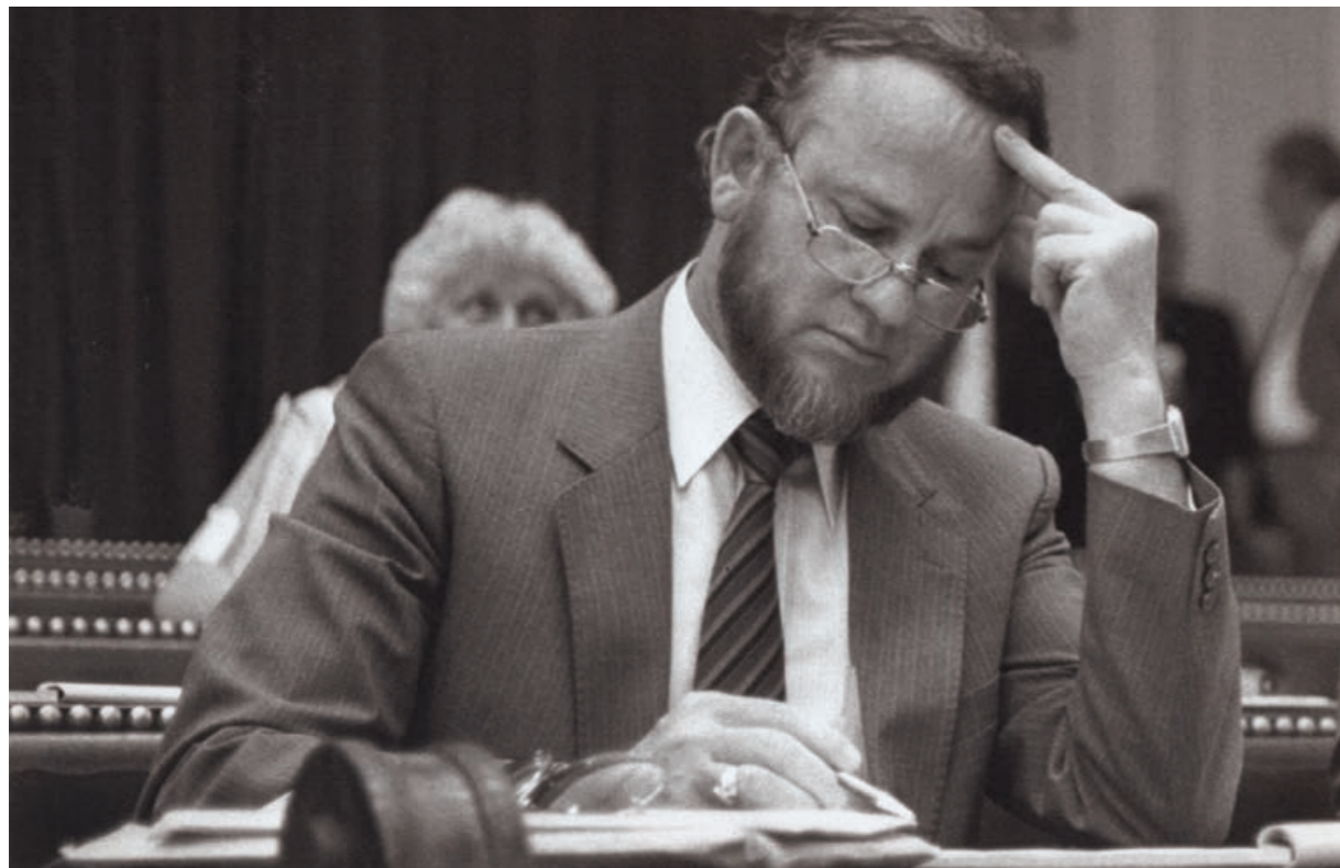
De Arubaanse politicus Betico Croes bepleitte met succes een status aparte voor Aruba

De wens van Aruba werd op 1 januari 1986 verwezenlijkt toen Aruba zijn langgekoesterde status aparte kreeg: Aruba werd een autonoom land binnen het Koninkrijk. Om Aruba (weer) meer zichtbaar te maken in Nederland moet het zich duidelijker als autonoom land profileren. Niet alleen in en rond het politieke centrum van het Haagse Binnenhof, ook op gemeentelijk en provinciaal niveau, in de Europese Unie, bij onderwijsinstellingen en maatschappelijke organisaties.