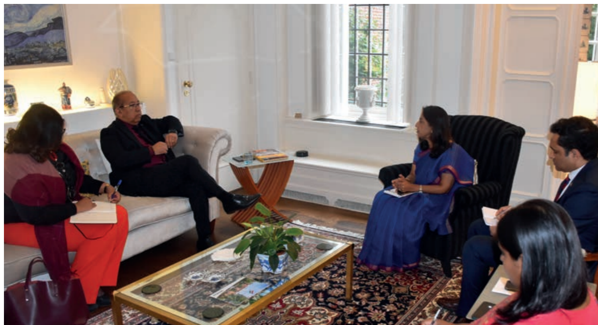
Overleg met de ambassadeur van India

De ambassadeur van India, Reenat Sandhu, sprak na haar bezoek op Aruba met minister Thijsen. Zij noemde het bezoek constructief en hoopt dat het deuren opent voor meer samenwerking op diverse gebieden tussen Aruba en India.