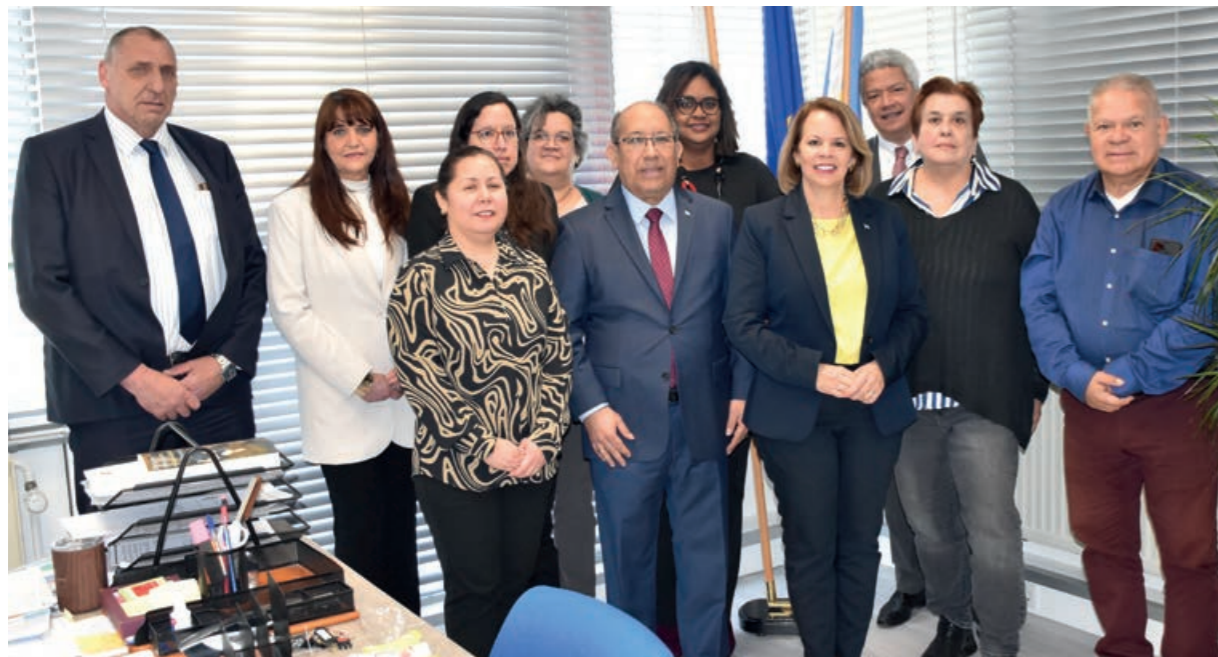
Minister-president Wever-Croes met het personeel van het Kabinet van de Gevolmachtigde Minister van Aruba

Voorts is in 2023 ingezet op vernieuwing van de website. Het Kabinet wil er onder meer zijn dienstverlening mee verbeteren en met een nieuw digitaal jasje bijdragen aan meer zichtbaarheid van Aruba in Nederland.