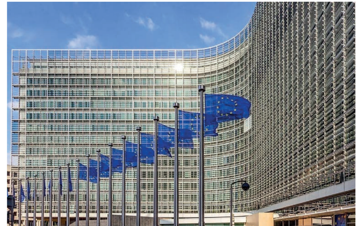
Europese Commissie in Brussel