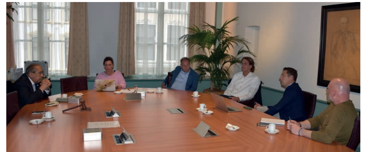
In gesprek met MKB Zwolle