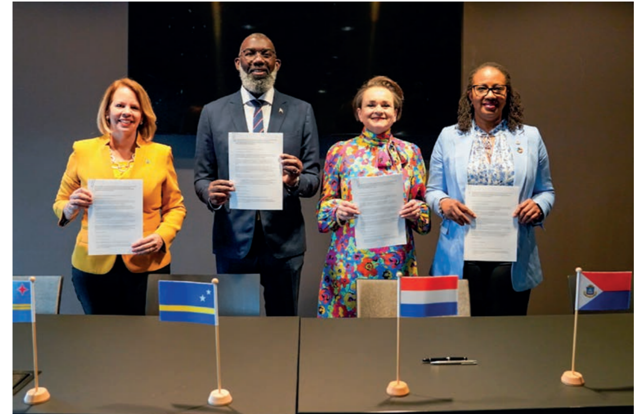
Minister-president Evelyn Wever-Croes van Aruba (links) bij de ondertekening Onderlinge Regeling

Naast financiële, economische en sociale hervormingen gaan de gesprekken met Nederland ook over hervormingen in het onderwijs, de gezondheidszorg en het versterken van de rechtsstaat. De Onderlinge Regeling komt in de plaats van de consensusrijkswet Caribisch Orgaan voor Hervorming en Ontwikkeling (COHO). Minister-president Evelyn Wever-Croes