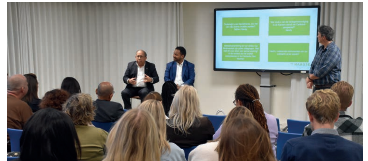
Presentatie bij het programma Minor Koninkrijksrelatie bij de Haagse Hogeschool

Tussen het Kabinet van de Gevolmachtigde Minister van Aruba en de Haagse Hogeschool bestaat al jaren een hechte relatie, vooral met de studiegroep Bestuur, Recht en Veiligheid en in het bijzonder met het programma Minor Koninkrijkszaken.