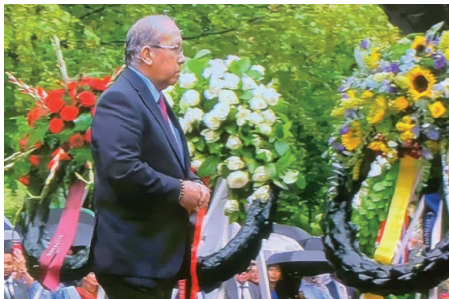
Herdenking Keti Koti

De bijeenkomst werd bijgewoond door de Gevolmachtigde Minister van Aruba. Bij die gelegenheid werd een plaquette overhandigd aan de Gevolmachtigde Minister van Curaçao met de formele tekst van de rehabilitatie. De plaquette zal door Nederland langs verschillende gemeenten rondreizen en als startpunt dienen voor participatie en dialoog over het slavernijverleden.