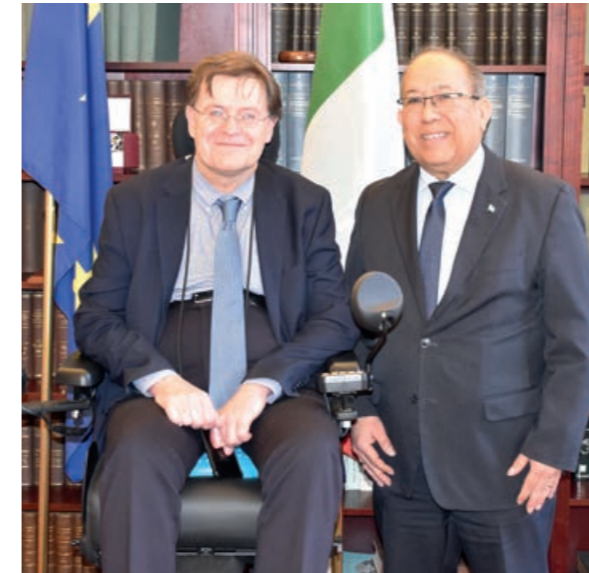
Kennismakingsbezoek aan de ambassadeur van Italië, Giorgio Novello