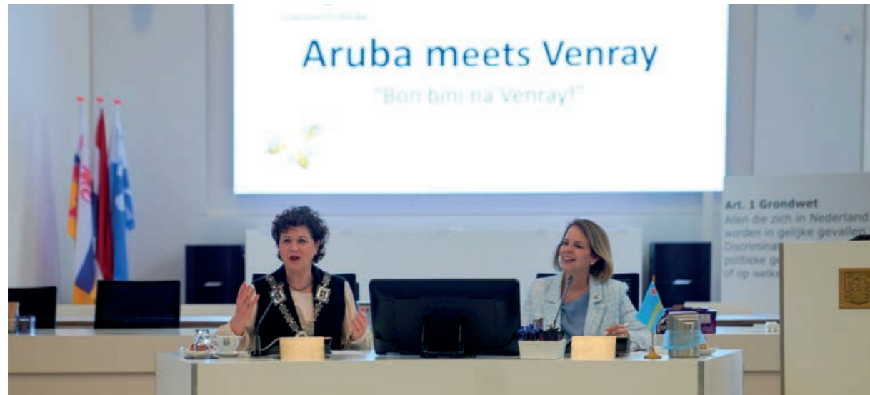
Minister-president Wever-Croes voor overleg in Venray met burgemeester Leontien Kompier

Het Kabinet van de Gevolmachtigde Minister van Aruba heeft in 2023 vele bezoeken gebracht aan gemeentelijke overheden. Aruba laat zich graag informeren over de praktijk en het belang van lokaal bestuur. In de gesprekken met burgemeesters staat de samenwerking met Aruba centraal.