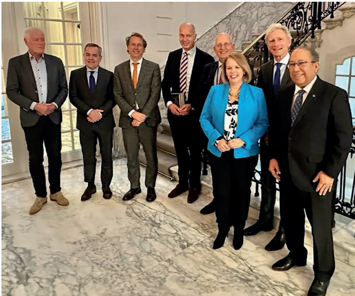
Premier Wever-Croes overlegde met leden van de Commissie Koninkrijksrelaties van de Eerste Kamer

Minister-president Evelyn Wever-Croes woonde later in het jaar een vergadering bij van de Rijksministerraad. Daarin werd gesproken over de herfinanciering van de coronalening van Nederland aan Aruba. Ook met Eerste Kamerleden van de Commissie Koninkrijksrelaties overlegde zij hierover. Voorts woonde de premier de afscheidsreceptie bij van Mildred Schwengle die in november bij de Raad van State afscheid nam als Staatsraad van het Koninkrijk voor Aruba.