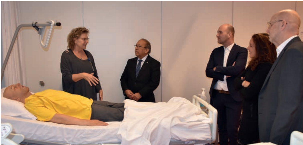
Aruba op bezoek bij NHL Stenden Hogeschool

Gevolmachtigde Minister Thijsen sprak onder meer met de NHL Stenden Hogeschool in Leeuwarden over de problemen met huisvesting voor Arubaanse studenten, over de mogelijkheden voor een eventueel partnerschap en over de ambitie van Aruba om meer aandacht te besteden aan zorgonderwijs.