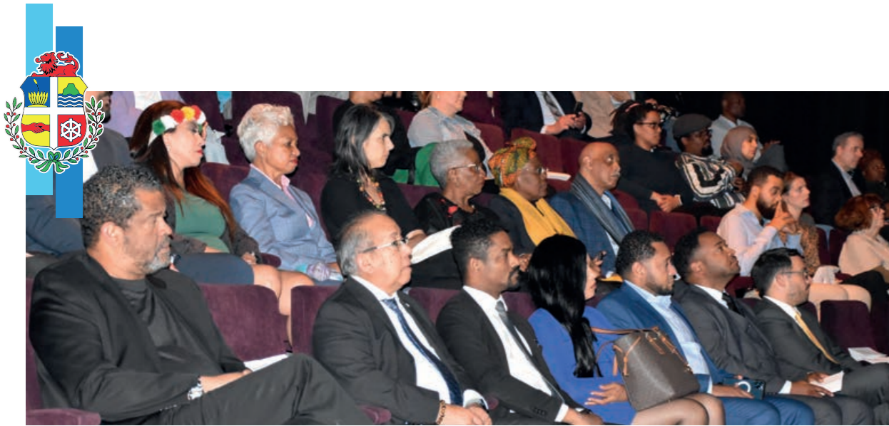
Voorstelling Tula in het Korzo Theater

In het Herdenkingsjaar Slavernijverleden werd op 3 oktober de op gruwelijke wijze gemartelde en vermoorde Curaçaose verzetsheld Tula officieel gerehabiliteerd door de Nederlandse regering. Dit gebeurde op Curaçao. In Den Haag, in het Korzo theater, vond een gedenkwaardige avond plaats in aanwezigheid van minister Hugo de Jonge van Binnenlandse Zaken en Koninkrijksrelaties, Volkshuisvesting en Ruimtelijke Ordening.