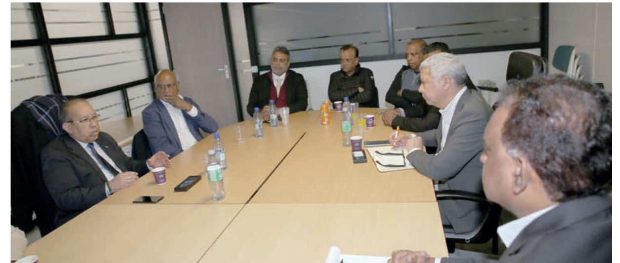
Overleg over bewerking Surinaamse landbouwproducten

Gedacht wordt ook aan het verbouwen van landbouwproducten met behulp van Nederlandse, Indiase en Colombiaanse agro-technologie.