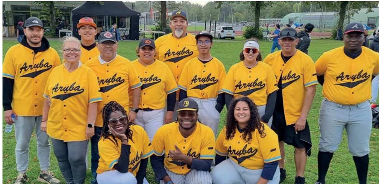
Softball Toernooi in Zoetermeer

Dit bestaat voornamelijk uit teams van Arubaanse studenten.