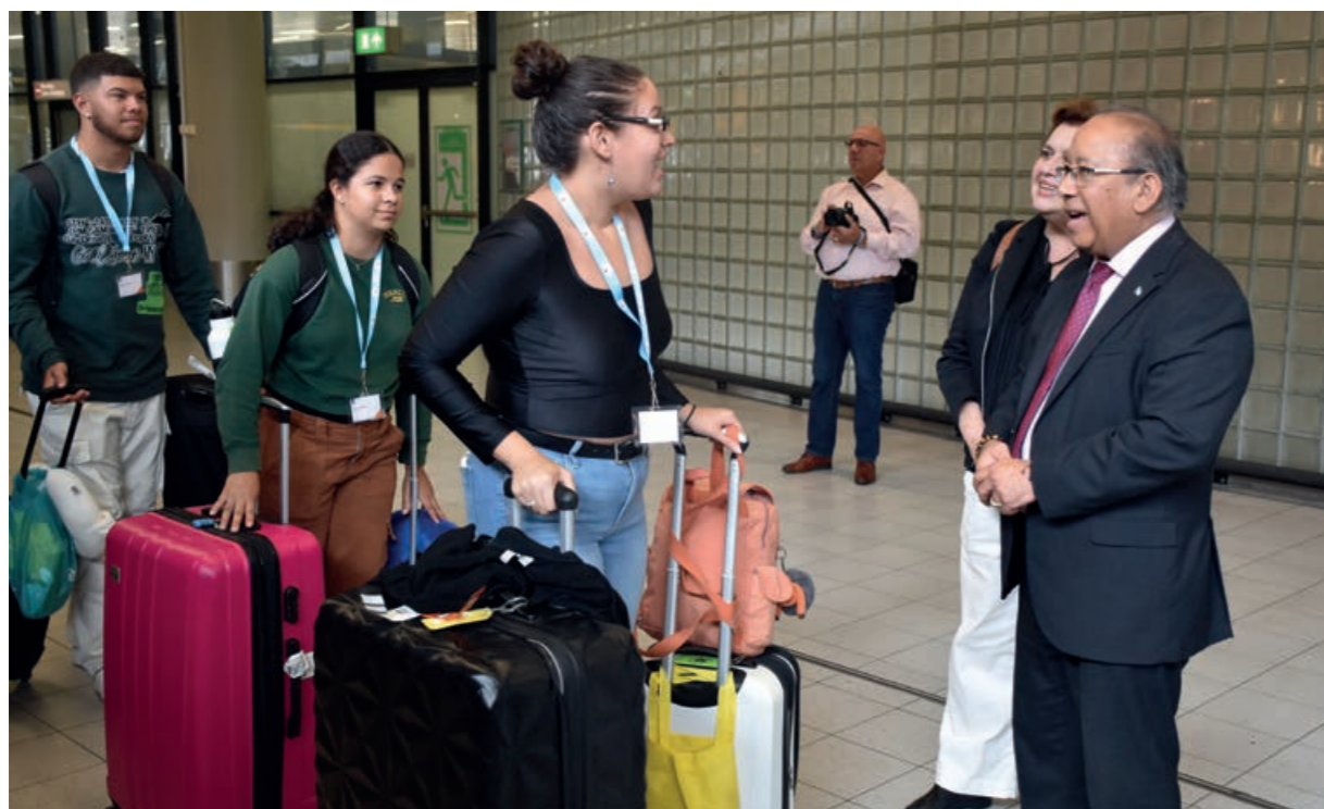
Aankomst Arubaanse studenten op Schiphol