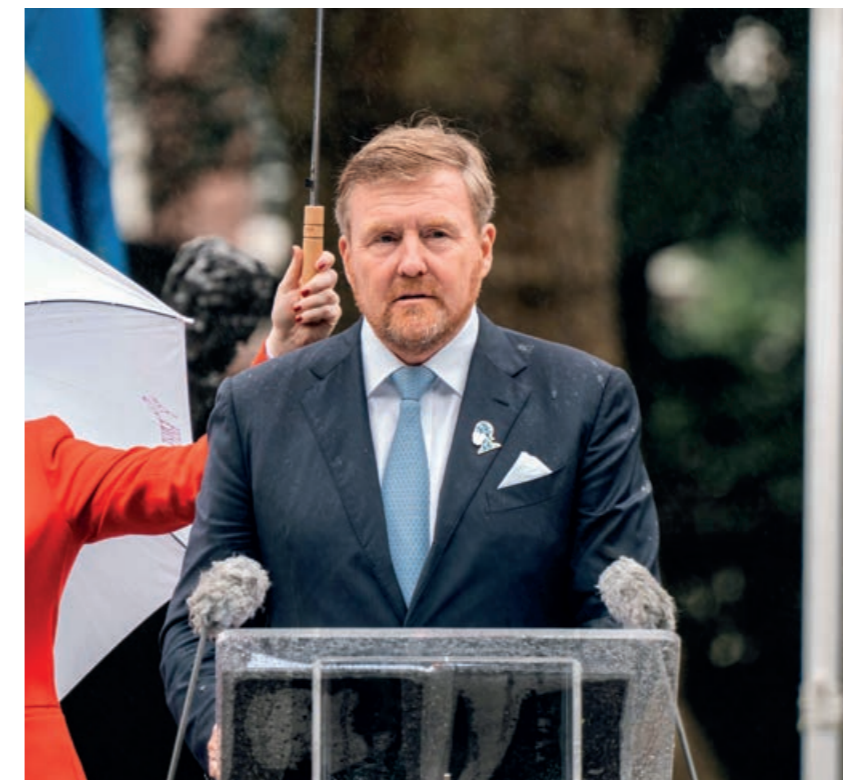
Koning Willem-Alexander bij de herdenking Afschaffing Slavernijverleden in het Oosterpark in Amsterdam

2023 was een bijzonder jaar: het Herdenkingsjaar Slavernijverleden. Op 1 juli 2023 was het 150 jaar geleden dat de slavernij bij wet werd afgeschaft op de Caribische eilanden en in Suriname. De Nationale Herdenking Nederlands Slavernijverleden in het Oosterpark in Amsterdam stond in het teken van excuses van de Nederlandse regering voor haar rol en betrokkenheid bij het slavernijverleden.