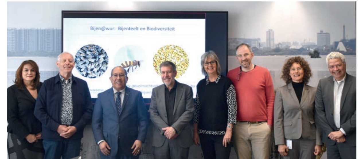
In gesprek bij Universiteit Wageningen

Bij het kennismakingsbezoek aan de Hanzehogeschool Groningen kwam de samenwerking met het bedrijfsleven aan bod door innovatieve werkplaatsen in de regio op te zetten. Ook een partnerschap met de Universiteit van Aruba kwam aan de orde. Hanzehogeschool Groningen heeft gezegd mogelijkheden tot samenwerking met Aruba te willen verkennen. Minister Thijsen maakte ook kennis met ArtEZ University of the Arts in Zwolle. Een van de gespreksonderwerpen: samenwerking voor meer studiemogelijkheden in Aruba.