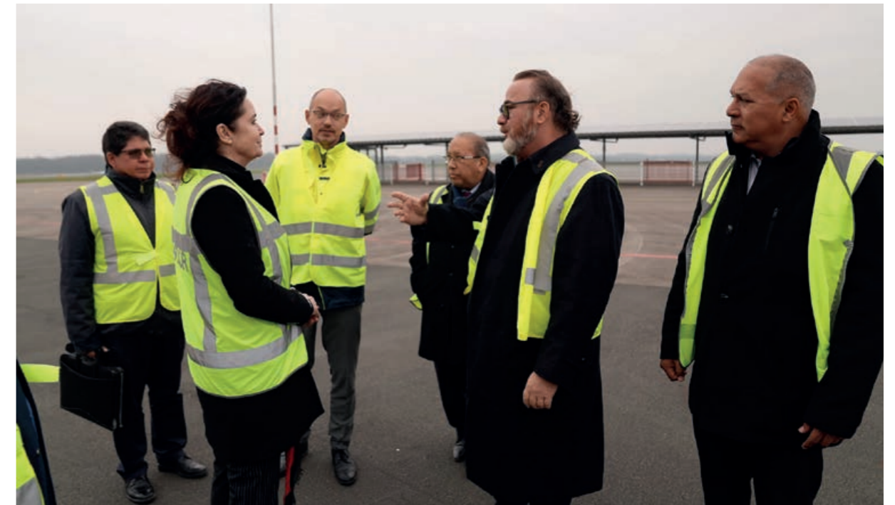
Minister van Energie Glenbert Croes tijdens zijn werkbezoek aan Groningen

Minister Glenbert Croes van Arbeid, Energie en Integratie bracht in februari een bezoek aan de provincie Groningen. Hij was onder meer bij Hydrogen Valley en bezocht de Eemshaven.