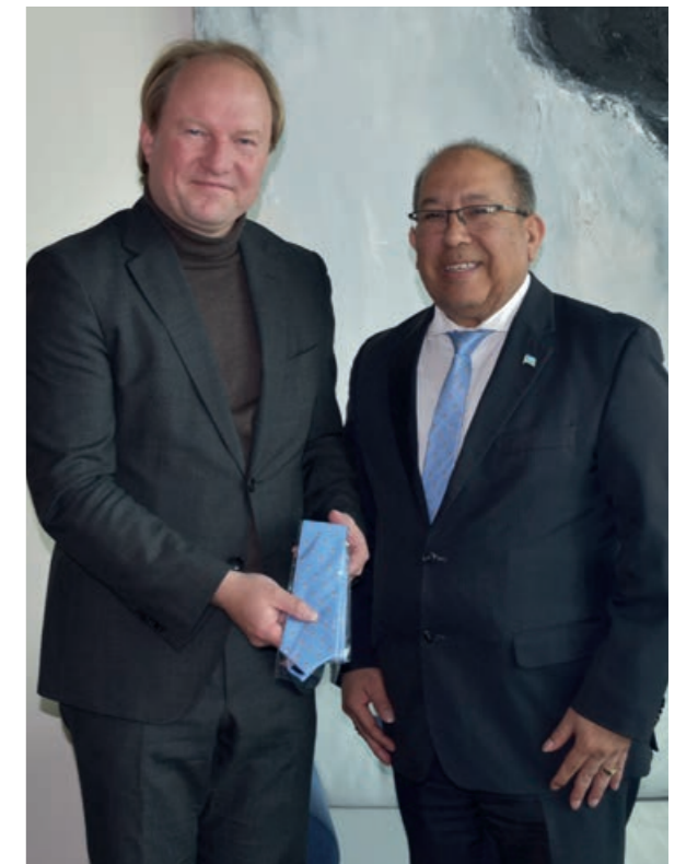
Bezoek aan burgemeester Hein van der Loo van Almere

In alle ontmoetingen met de gemeenten uitte minister Thijsen zijn bezorgdheid over de problemen die studenten ervaren om huisvesting te vinden. Gemeenten toonden hun begrip, maar maakten ook duidelijk dat dit een landelijk probleem is waar alle studenten tegenaan lopen.