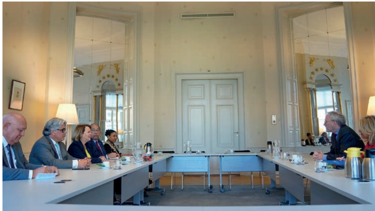
Een delegatie onder leiding van premier Evelyn Wever-Croes overlegt met vice-president Thom de Graaf van de Raad van State

Ook had minister Tjon een ontmoeting met Anna Paolini van Unesco Caribisch Gebied. Hierbij werd gesproken over twee programma's van Unesco Caribisch Gebied, 'peace building' en 'changing mentalities'. Het project 'peace building' richt zich op agressie op school. Het andere programma is meer gericht op bewustwording bij de gemeenschap over huiselijk geweld. De Nationale Unesco Commissie van Aruba zet zich onder meer in voor kwaliteitsverbetering van het onderwijs.