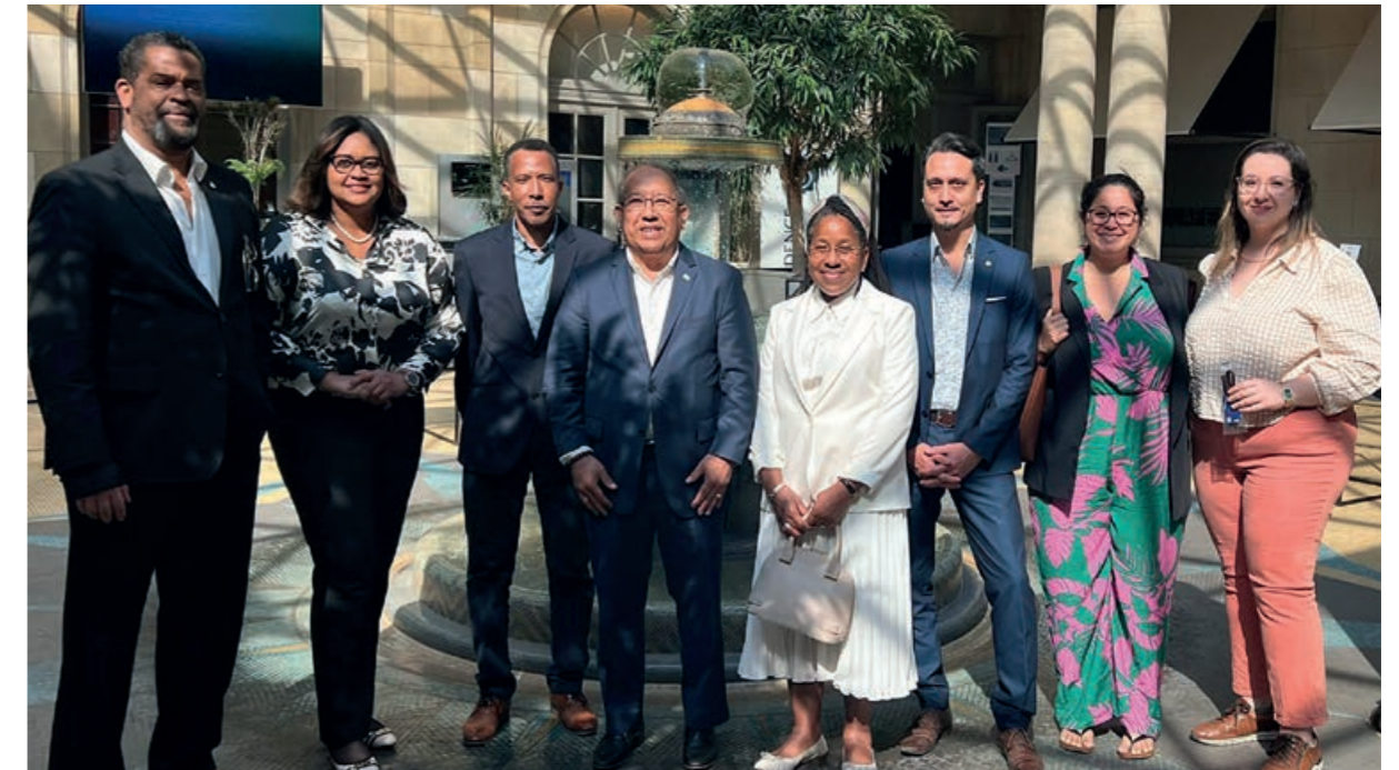
Workshop Bestlife 2030-programma in Brussel

De Gevolmachtigde Minister van Aruba is de vertegenwoordiger van Aruba bij de Europese Unie. Een belangrijke schakel voor Aruba bij de Europese Unie is de Overseas Countries and Territories Association (OCTA).