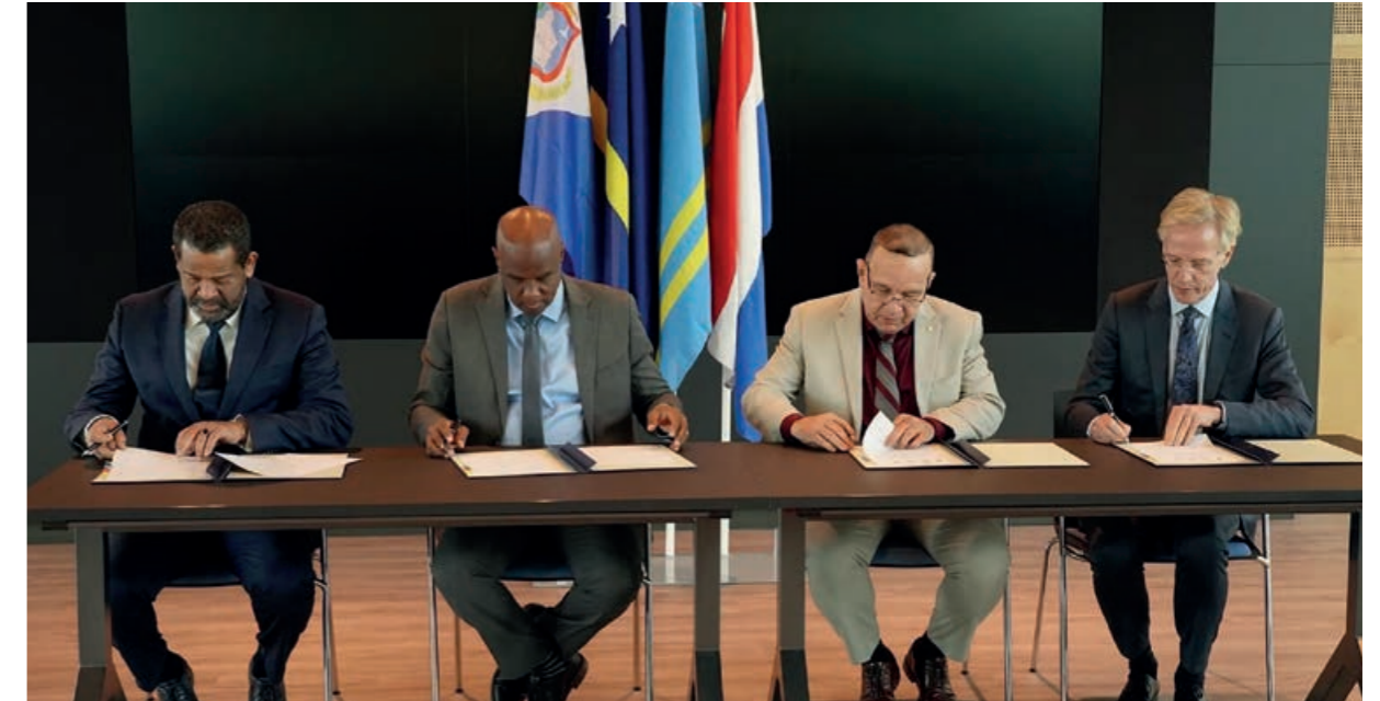
Minister van Onderwijs Endy Croes (tweede van rechts) bij het Vierlanden Overleg Onderwijs

Minister Endy Croes van Onderwijs en Sport en minister Xiomara Maduro van Financiën en Cultuur woonden het Vierlandenoverleg Onderwijs en Cultuur bij in Nederland. Tijdens het Vierlandenoverleg Onderwijs werd een nieuwe programma structuur getekend voor de 'Strategic Education Alliance' (SEA). Dit is een Koninkrijk breed samenwerkingsprogramma tussen overheids- en onderwijspartijen van de vier landen binnen het Koninkrijk dat zich ten doel stelt het studiesucces van de Caribische student te optimaliseren.