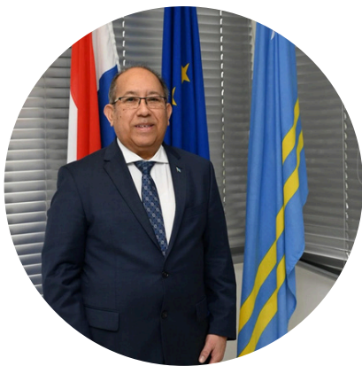
De Gevolmachtigde Minister

De Gevolmachtigde Minister vertegenwoordigt de Arubaanse gemeenschap in Nederland en in de Europese Unie, en fungeert indien nodig als vraagbaak voor de Arubaanse ministeries op diverse werkkterreinen zoals onderwijs, cultuur, economische en sociale zaken. Daarnaast geeft de Gevolmachtigde Minister advies aan de Minister van Algemene zaken over de vorming dan wel realisatie van het te voeren strategisch beleid voor het werkkterrein. De huidige Gevolmachtigde Minister is tevens de EU-vertegenwoordiger. Hij behartigt de Arubaanse belangen en verdedigt de standpunten zoals bepaald door de Arubaanse regering in de Europese Unie.